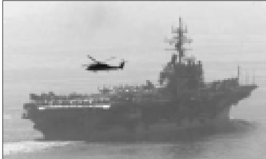
البارجة الامريكية في مياه الخليج

أكد الرئيس جورج بوش الأمفاوضات مع النظام العراقي وأن أيام النظام كدولة خارجة على القانون باتت معدودة... وزاد في تصريحه المقتضب (إن الولايات المتحدة تريد أن تجعل العالم يتمتع بمرز من السلام ومزيد من العدل) وكان الكونغرس بمجلسيه الشيوخ والنواب قد منح بوش صلاحية واسعة تجيز له استخدام القوة ضد النظام الدكتاتوري ... كما اشارت الاخبار إلى تحرك ستة قطع حربية امريكية إلى الخليج العربي، منها ثلاث حاملات طائرات بعد أن تم تقديم موعد مغادرتها بعد أن كان مقررا مغادرتها مدينة ديغو في جزيرة كورنارد بداية العام المقبل. من جهة أخرى ذكرت الأنباء أن السلطات الكويتية أغلقت ثلث أراضي البلاد لتأمين مناورات عسكرية بقيادة