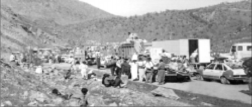
اكراد مهجرون الى ايران عام ١٩٩٠

حتى الان، ولهذا فان ما جرى للاخوة الكورد الفيلية من نظام صدام هي جرائم دولية لا تسقط بمرور الزمان ولا بد من تعويض المتضررين منهم حسب القانون بعد اعادتهم الى وطنهم العراق وهذه الحملات ضدهم بدأت منذ بداية السبعينات واشتدت بصورة كبيرة جدا قبل اشتعال الحرب العراقية - الايرانية وبعدها جرت ترويع اموال الاخوة الكورد الفيلية على المسؤولين في حزب البعث وازلام نظام صدام خلفا للقواعد الاخلاقية والدينية والقانونية.