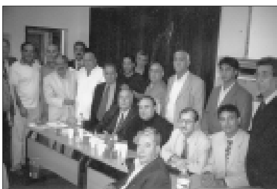
صورة تذكارية على هامش اجتماعات المؤتمر التأسيسي للمجلس العام للكرد الفيليين

سياق نهجها، وهناك تيارات تجد نهجها العقدي افضل العقائد وما خارجها لا يوصل الى الجنة المنشودة، وهناك تيار يجد في طرح الفيليين لانفسهم تجاوز على حدود الوطن المقدس، وهناك من يجد في طرح الفيليين لانفسهم عراقيين تجاوزا على توافق مع نهج السلطة القائمة بعدم درج هذه الشريحة ضمن امتهم الكردية لتلا يمثلون عددا في صناديق اقتراح، استحقاقات وحقوق، لذا يجب بمنهج هؤلاء الذين في قاع فكرهم الغاء الآخر، الغاء الفيلية كشريحة وما تتبعه من حقوق. أما من يعتبر اطلاق للنظام سراح سجنائه خطوة مقدمة لنهج سلطة، نجد فيه تجاوز على حقوق الانسان الذي يجب علينا تجسيده بالتنديد بخطوات النظام وكل حساباته. فهو لم يخلق عمليات الاغتيال والقتل اثناء عمليات الاغتيال ولم يشر لا من قريب ولا من بعيد الى مصيرهم، ولم يطلق سراح ٨ الاف بارزاني تم اعتقالهم، ولم يطلق سراح ٣ الاف من الشباب الفيليين الذين تم احتجازهم بعد شرد اهلهم وذويهم الى حيث الحدود، وكانت خطة النظام انذاك هو استبدالهم بأسرى حربهم مع الايرانيين على اتمهم ايرانيين، ولم يكن لهم في تلك الحرب لاناقة ولاجمل، سوى أنهم تجاوزا على توافق مع نهج السلطة القائمة بعدم درج هذه الشريحة ضمن امتهم الكردية لتلا يمثلون عددا في صناديق اقتراح، استحقاقات وحقوق، وهي ضمن لعبة كانت، وتطالب الكل بالعمل من أجل الكشف عن مصيرهم. أما لماذا اطلق النظام سراح من كان في سجنونه، هي ضمن لعبة للنظام، تمنى ان لا يكونوا وقودا للحرب القادمة، أو اهدافا سهلة للذليل منها في الشوارع والمقاهي، حيث عمليات الدس المجهول الهوية والقتل والاعتقال والتصفيات الجسدية. وهنا نتساءل لمصلحة من هذه الاحكام المسبقة على الفيليين؟ مراقب كردي