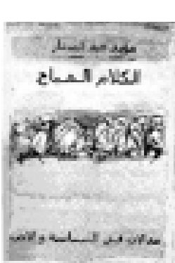
مقالات في السياسة والأدب