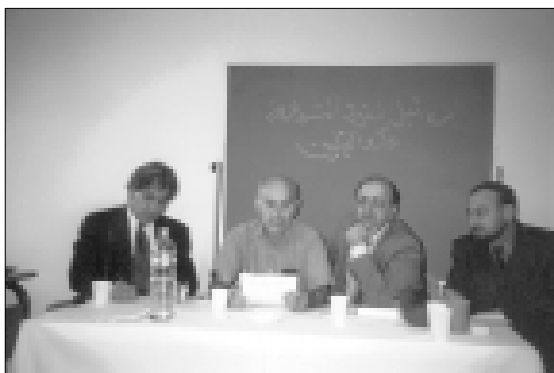
صورة من ادارة اجتماعات المؤتمر التأسيسي للمجلس العام للكرد الفيليين

وعلى مدار الايام الثلاثة لاتعداد المؤتمر ساهم الجميع في التوصل الى نتائج هادفة تضع الامور في نصابها من أجل العمل على تحقيق الاهداف النبيلة للكرد الفيليين الذين عانوا جميع الوان الاضطهاد على يد العصابة المجرمة الحاكمة ببغداد. لقد حاول المؤتمرين بناء منظمة ديمقراطية تفتح الابواب أمام جميع أبناء الكرد الفيليين خاصة بالتعاون مع ابناء الشعب العراقي عامة من أجل تحقيق الاهداف المشروعة ورفع الحيف الذي لحق بهم جراء السياسات العنصرية والشوفينية للنظام الصدامي.