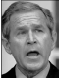
الرئيس جورج بوش