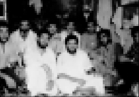
مجموعة من المحتجزين الذين غيبوا في سجون الدكتاتورية الصدامية